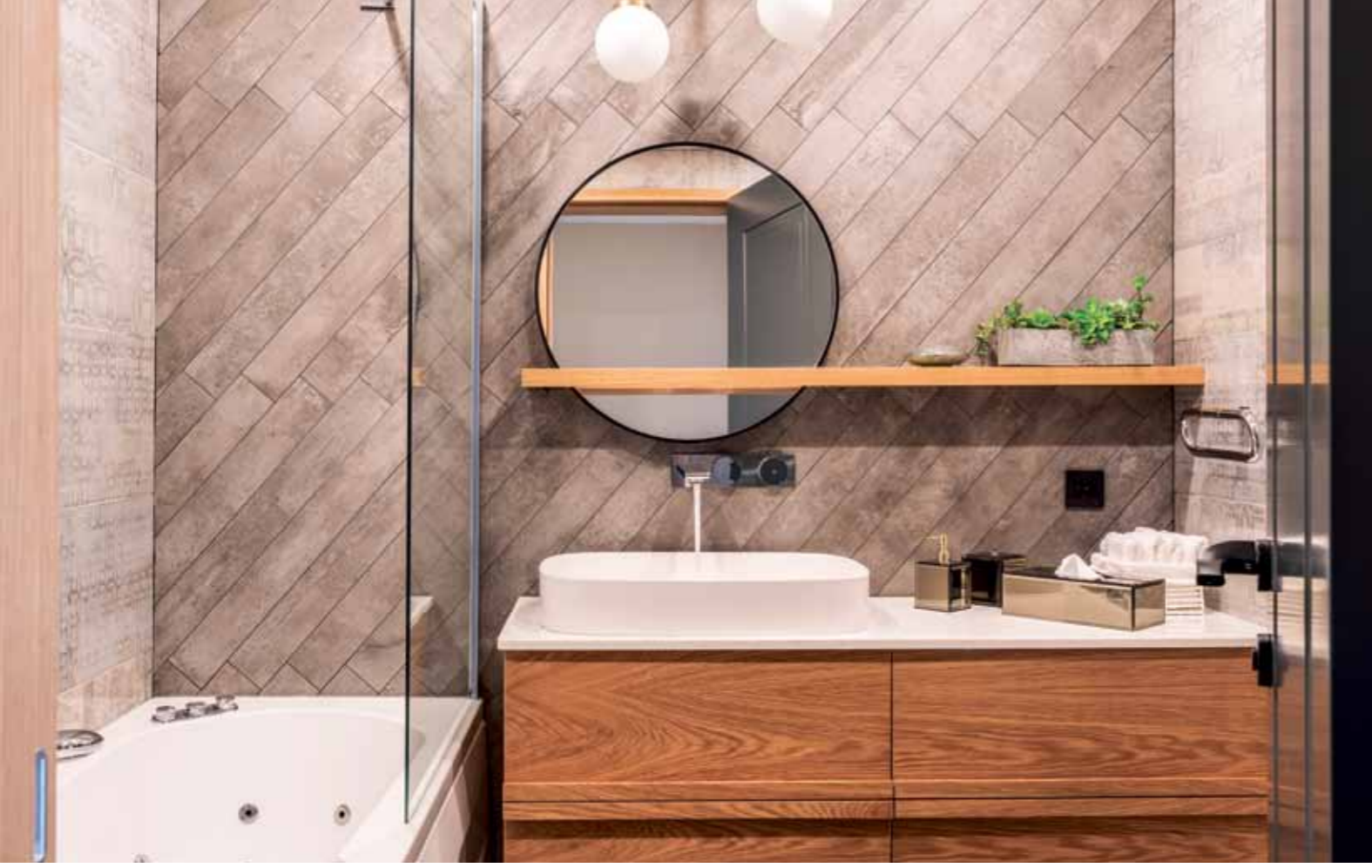
ÜSTTE Seramik ve vitrifiye ürünleri Vitra'dan seçilen misafir banyosunda zemin seramiği duvarda devam ettirilmiş. Mobilyalar özel üretim. ALTTA Ebeveyn odasının Armony Mobilya ile çalışılan yatak başı gizli ışıklı yatak ve dolap ünitesi özel üretim. Perdeler Persan, yatak başı duvarındaki mumluk ve yatak örtüsü Crate&Barrel koleksiyonlarından, ebeveyn banyosunun seramik ve vitrifiye ürünleri Vitra'dan seçilmiş.